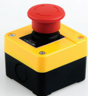
SE-101 Nouzové tlačítko