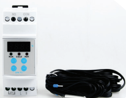
DIN TC Regulátor teploty