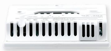
GS-201 (9-25V) Detektor hořlavých plynů