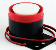
PS-101 Piezoelektrická siréna