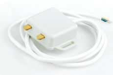
ZS-100 Záplavový detektor